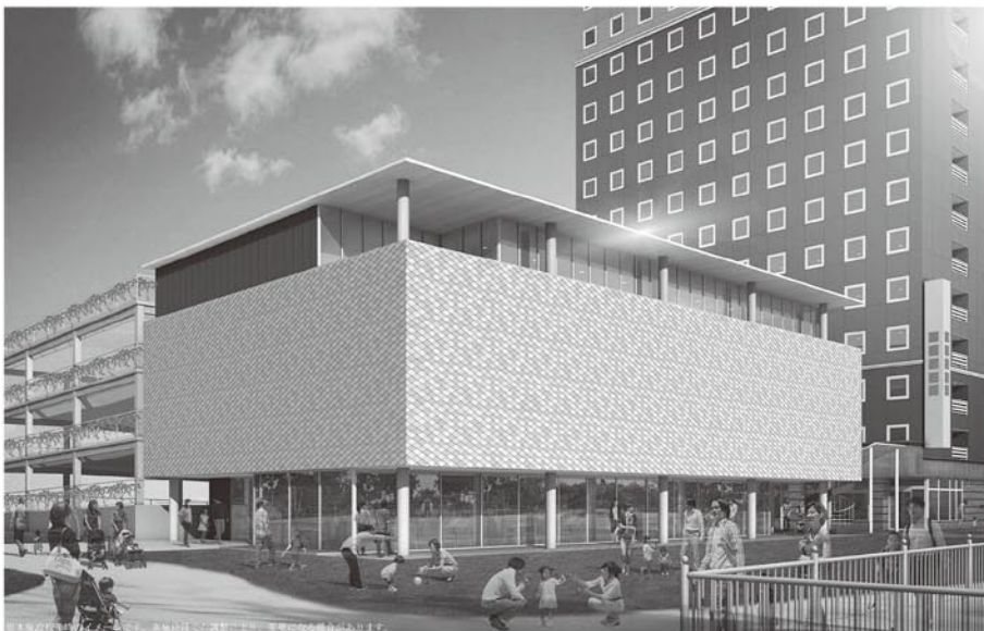
本施設及び民間宿泊施設の外觀イメージパース